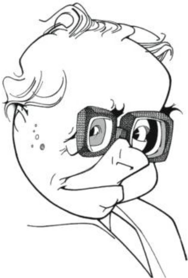
George Steiner (París, 1929) visto por Loredano.

“La filosofía”, escribe Steiner en su afóristico prólogo, “enseña que la negación puede ser determinante”. Tal afirmación, además de ofrecer una discreta justificación al volumen, sugiere algo más, algo profundo y esencial, que Steiner comenta brevemente en el séptimo de sus libros no